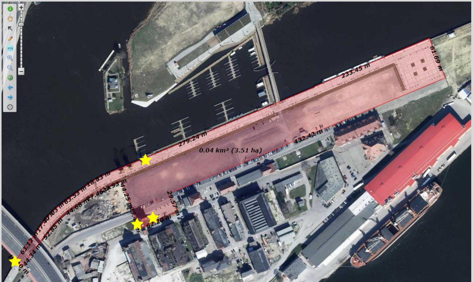
Fot. 4 – Nabrzeże Starówka