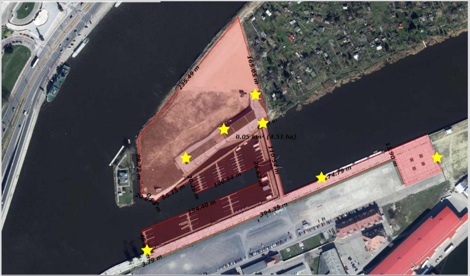
Fot. 5 – Port Jachtowy/Wyspa Grodzka